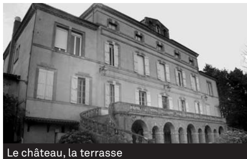
Le château, la terrasse