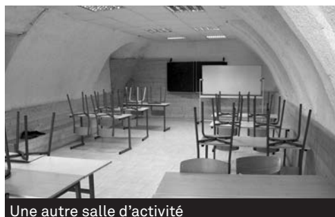
Une autre salle d'activité