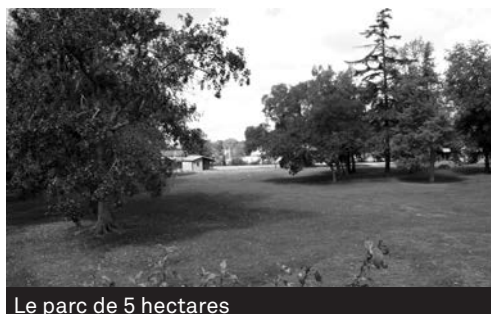
Le parc de 5 hectares