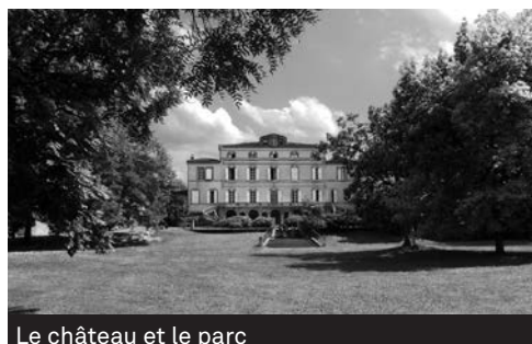
Le château et le parc