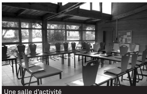
Une salle d'activité